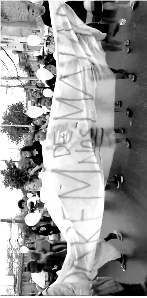
Comunidade protesta contra assassinato de criança pela polícia.

A desigualdade social e o terror mantido pela violência policial nunca trarão qualquer tipo de paz. A violência contra pessoas negras, periferias, LGBT, manifestantes, povo da rua, indígenas, dissidentes políticos e imigrantes não são “casos isolados” como querem nos fazer crer. O pro-